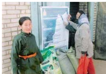
Малчид өвс тэжээлээ хүлээн авч байгаа нь Бэрх тосгон, Хэнтий

-380 тонн хорголжин тэжээлийг нийт 66 сумын 11617 өрхөд олгосны 9536 буюу 82 хувь нь цөөн малтай ядуу өрхүүд байв.