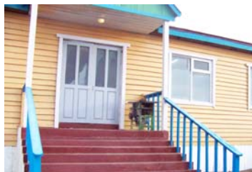
Хөвсгөл аймгийн Ханх суманд барьсан 10 ортой шинэ эмнэлэг.

2007 оноос эхлэн баригдсан Хөвсгөл аймгийн Ханх, Алаг-Эрдэнэ, Хэнтий аймгийн Баянмөнх сумын шинэ эмнэлгүүдийг ашиглалтанд оруулж, тус бүр 20 сая төгрөгийн тоног төхөөрөмж, зөөлөн эдлэлээр хангасан.