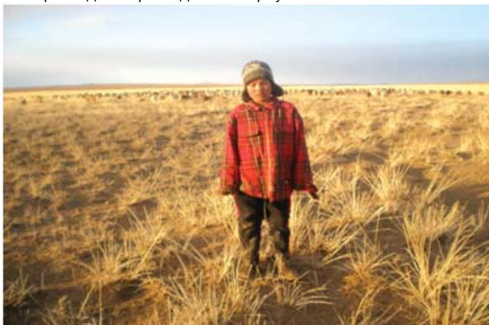
Тайлбар. Хонь, ямаа хариулах гэдэг хүүхдийн хийх гол хөдөлмөр гэж томчууд үздэг.

Эцэг эхчүүд мал угаах, эмнэг сургах, мал нядлахаас бусад тохиолдолд МАА-н үйлдвэрлэлийн ихэнх ажлуудыг хүүхдээр хийлгэж болно гэжээ. Ялангуяа мал хариулах, аргал түлш бэлтгэх, хашаа хороо цэвэрлэх, төл бойжуулах, мал тэжээх, ус авах, мал услах, ямаа самнах, хөрзөн ховлох, ноос ноолуур авах, өвс хадлан бэлтгэх, мал саах ажлуудыг хүүхдийн хийх ажил гэж дийлэнх эцэг эхчүүд үзэж байна. Айлд хүүхдээ мал маллуулж байгаа эцэг эхчүүдийн 77.3 хувь нь хүүхэд мал малласнаар идэх хоол, өмсөх хувцастай болж гэр бүлийн орлогод нэмэр болдог гэж хариулж байлаа.